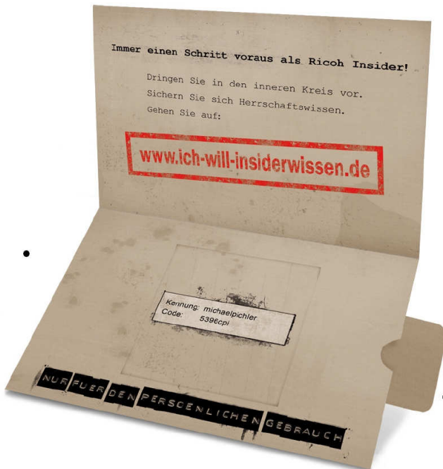
Zugangsdaten sind sichtbar. Mit ihnen loggt man sich auf der Webseite ein.